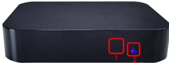
表 1 正面接口说明