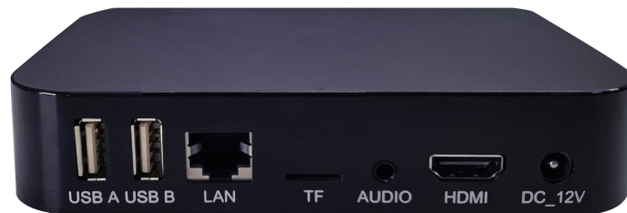
表 2 背面接口说明